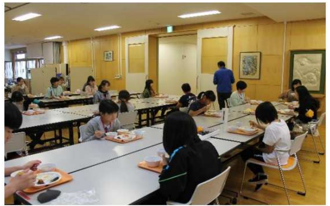
〈ラジオ体操・朝食〉