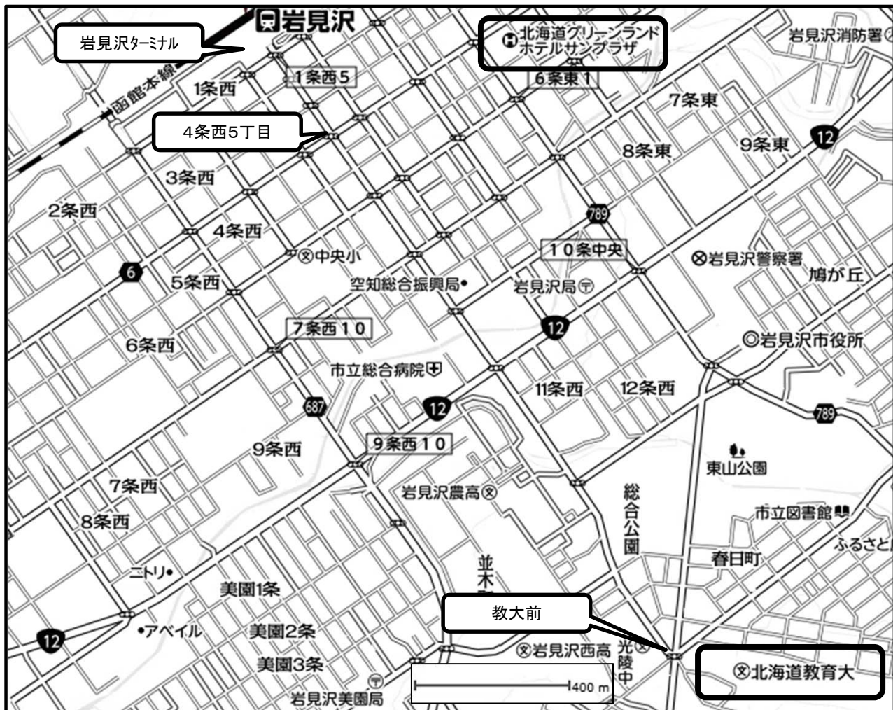
岩見沢市内 位置図

• 札幌市内から岩見沢市内への移動は次のとおりです。 乗用車：道央自動車道（札幌JCT－岩見沢IC間）約30分 J R：札幌駅－岩見沢駅は、普通列車1時間2本・約40分、特急列車1時間1～2本・25分 高速バス：札幌駅前ターミナル－岩見沢ターミナルは、1時間4本・約60分 • 旭川市内から岩見沢市内への移動は次のとおりです。 乗用車：道央自動車道（旭川鷹栖JCT－岩見沢IC間）約80分 J R：旭川駅－岩見沢駅は、特急列車1時間1～2本・約60分