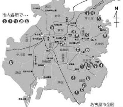
名古屋市区図 (50倍縮 2013年4月版)